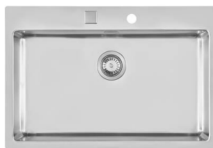
Lavello KE Sopratop I Filotop 2266 050